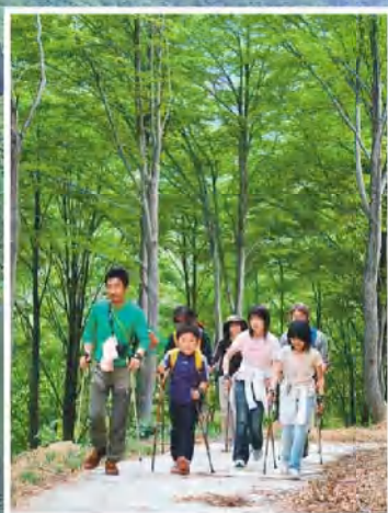
ノルディックウォーキング