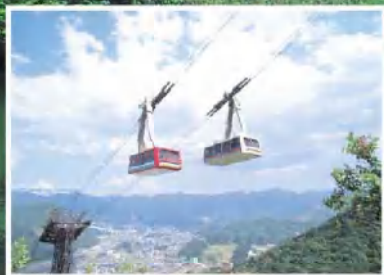
湯沢高原ロープウェイ