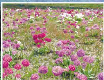
湯沢高原アルプの里(タマザキサクラソウ)